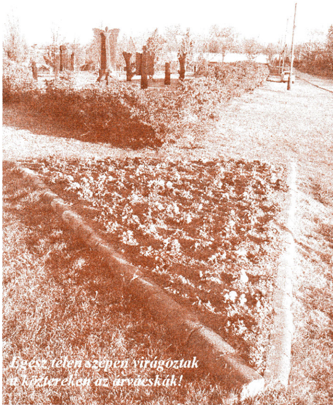
Egész télen szépen virágoztak a kőtereken az árvácskák!