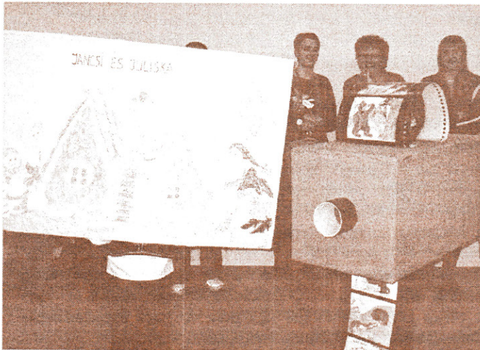
Vetítő és vetítővászon