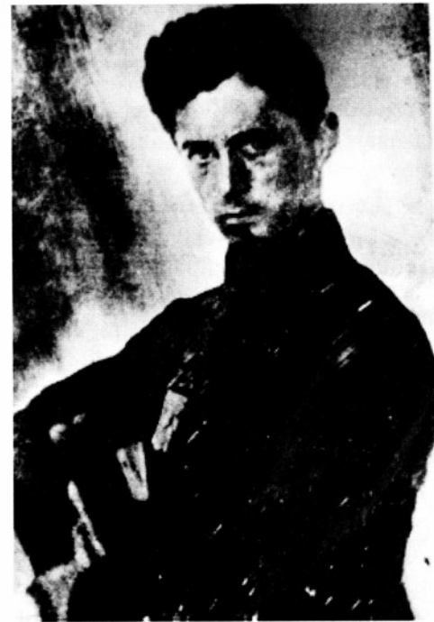
Petőfi Sándor (1823-1849)