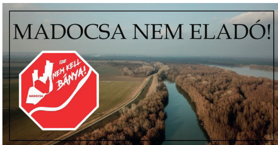
1. kép: Még mindig nem!

Sajnos örömünk nem sokáig tarthatott. 2020. július 30-án megjelent egy hirdetés a Baranya Megyei Kormányhivatal oldalán, miszerint Madocsa közigazgatási területén a BET-KAVICS Kft. ásványi