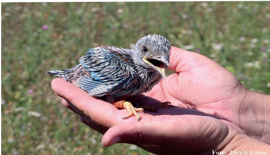
Fotó: Törjék Gábor

Törjék Gábor egyesületi elnök Madocsaért Egyesület