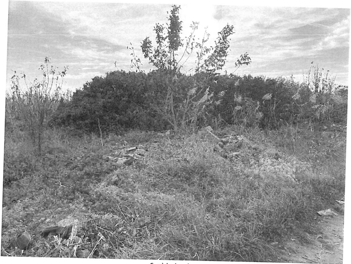
6. a) helyszín