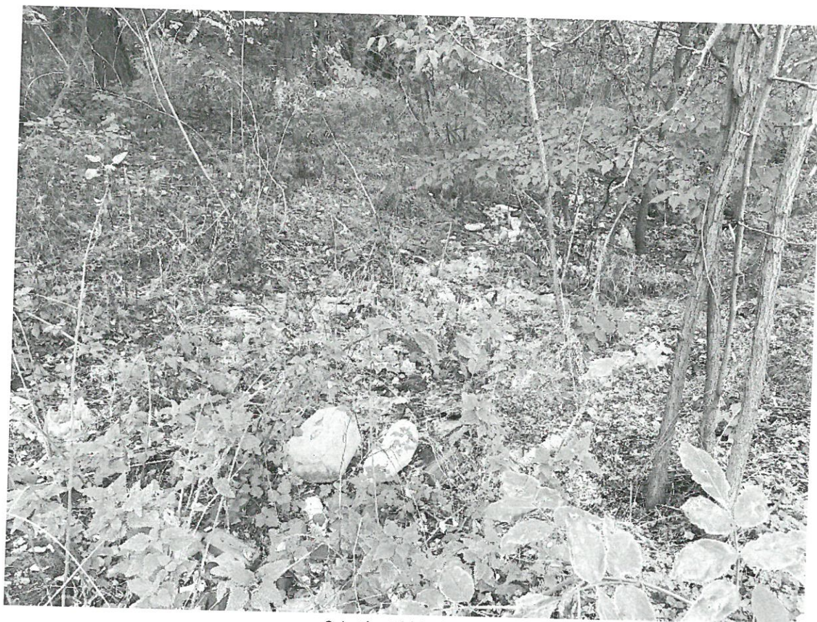
Szintén 6.b) helyszín