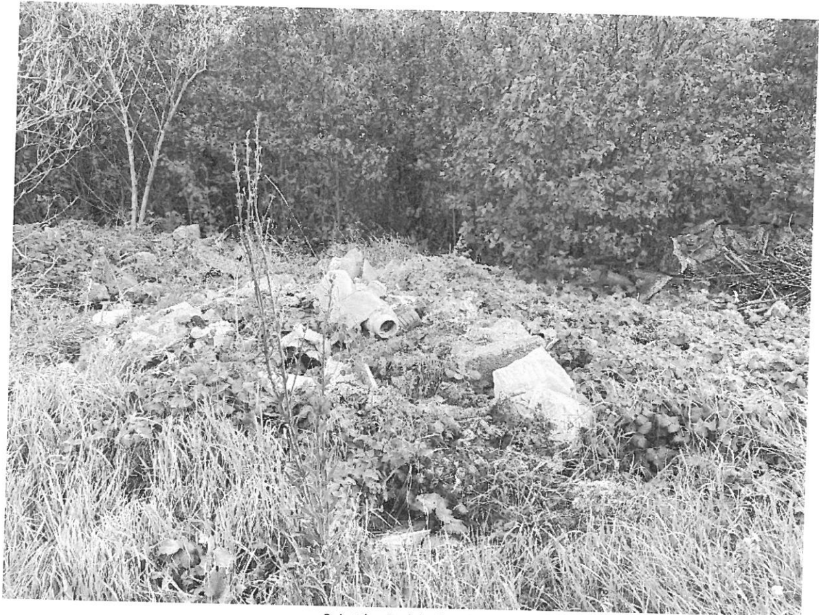
Szintén 6.a) helyszín