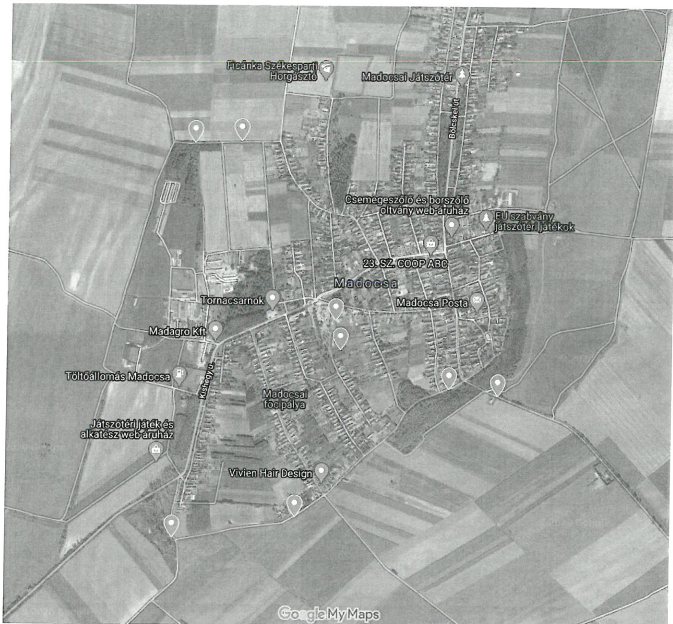
Az egyes helyszínek piros jelölővel láthatók a térképen.