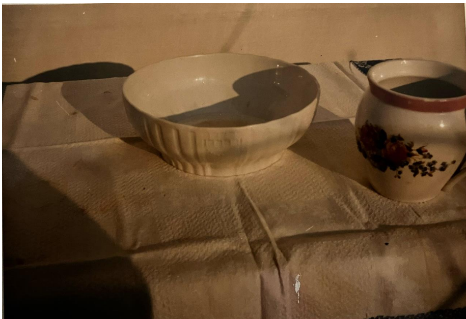
Nászajándékba kapott bögre, paprikástál, kézzel szövött terítő.

A képen egy kiállítás részlete látható, régi madocsi szoba berendezését gyűjtötték össze. Baloldalt a komódon (sublót) látható néhány nászajándékba kapott bögre, virágos tányér a századfordulóról. A magasra vetett ágy díszje a kézzel hímzett vánkosok sora volt, a huzat alatt színes béléssel. Régi a festett nyoszója is. A falon vőlegény-menyasszony kép. (I. világháború idejéből)